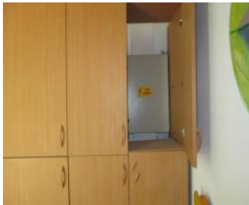
תמונה 2 : אולם הגן